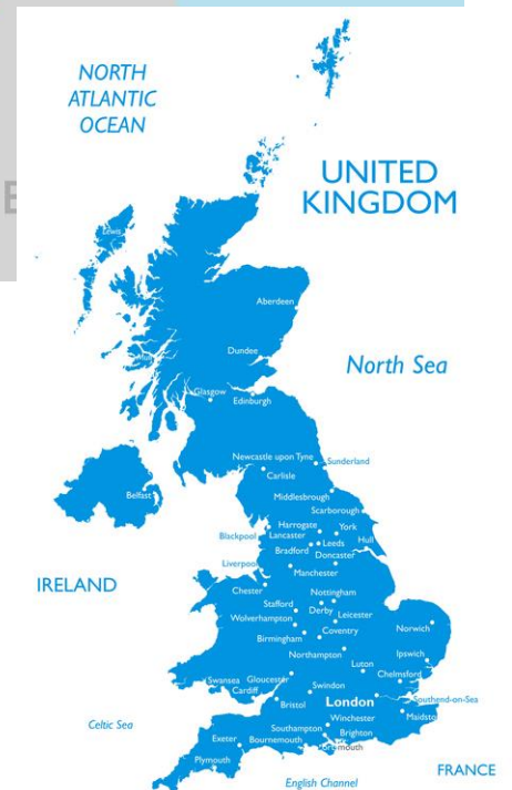
Maps used under licence to the City of Edinburgh Council